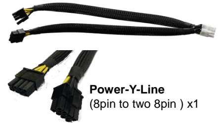
Power-Y-Line (8pin to two 8pin ) x1