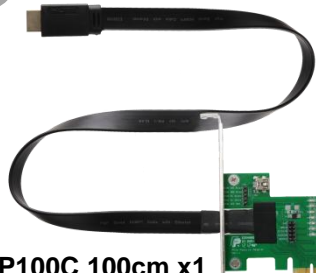
HP100C 100cm x1 PCI-e to HDMI