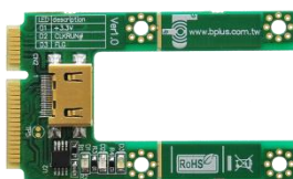
PM4N x1 mPCI-e to HDMI