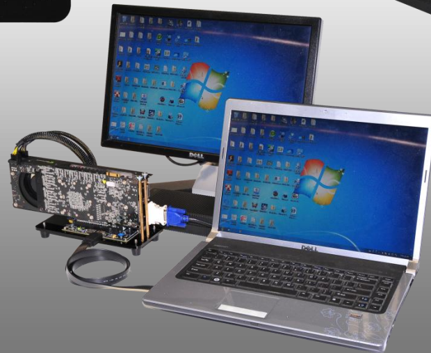
PE4C V2.1 Use case