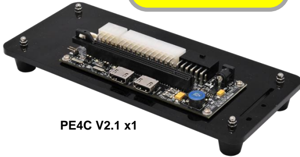
PE4C V2.1 x1