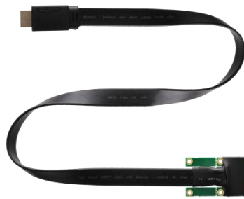
PM100C V1.0 100cm x1 mPCI-e to HDMI