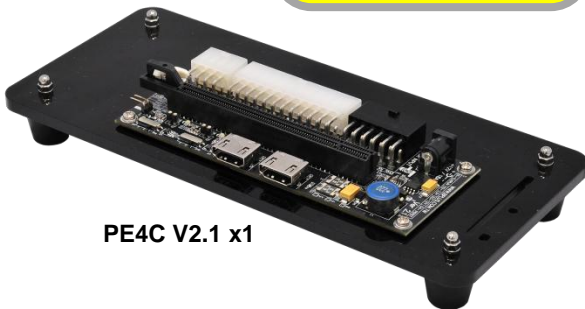
PE4C V2.1 x1