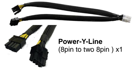
Power-Y-Line (8pin to two 8pin ) x1