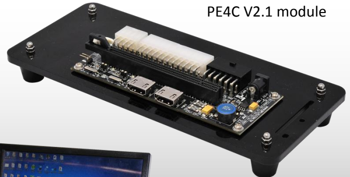
PE4C V2.1 module