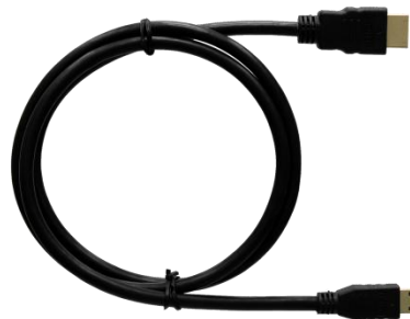
Mini HDMI to HDMI Cable 95cm