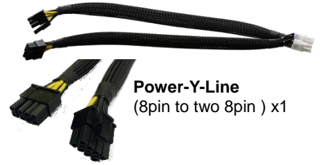
Power-Y-Line (8pin to two 8pin ) x1