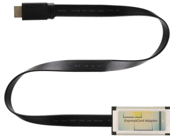
EC100C 100cm x1 Express card to HDMI